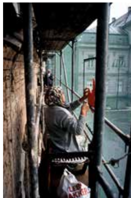
01 働く女性たち — 建設中 Women at Work – Under Construction 1999 11分48秒 11 min. 48 sec. DV 2001購入 / Purchase

©Maja BAJEVIĆ photographs: "Under Construction," SCCA, Sarajevo, Bosnia and Herzegovina (Curator Dunja Blazevic), 1999.